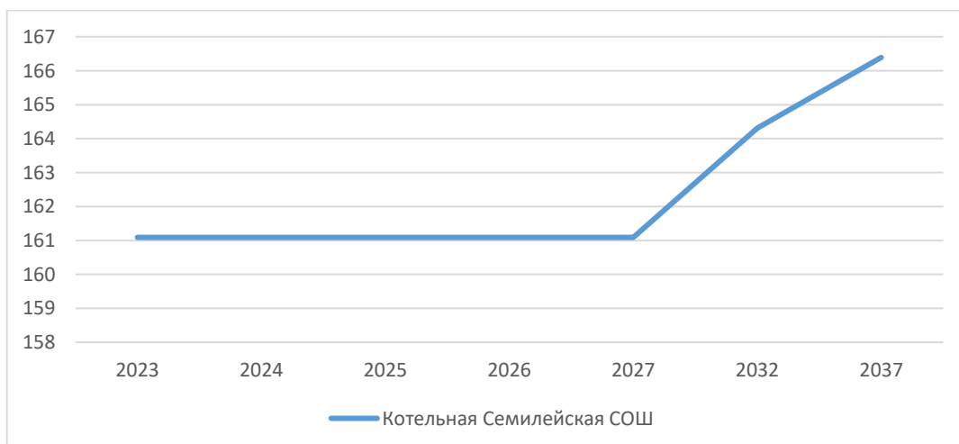
Рисунок 1. Динамика НУР топлива (утв.) на период 2023 - 2037 г.г

Прогнозы по отпускаемой тепловой энергии и топливопотреблению рассматривались по котельным, которые задействованы в схеме теплоснабжения, со следующим допущением: производство тепловой энергии ведомственной котельной остаётся на уровне базового года. Перспективное значение удельных расходов топлива на производство тепловой энергии приведено на рисунке 1 и в таблице 11.